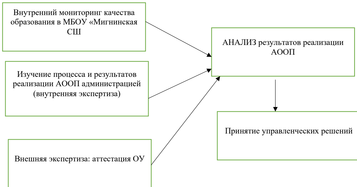
Схема организации контроля за реализацией ООП